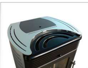
Vue de côté du top.